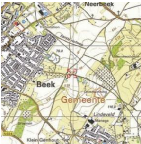
Figuur 1: Locatie Voedselbos Beek

Op het perceel staan diverse hoogstambomen en omzoomd door een haag. Op het perceel is tevens een eenvoudige veldschuur aanwezig. (Arvalis makelarij, 2015)"