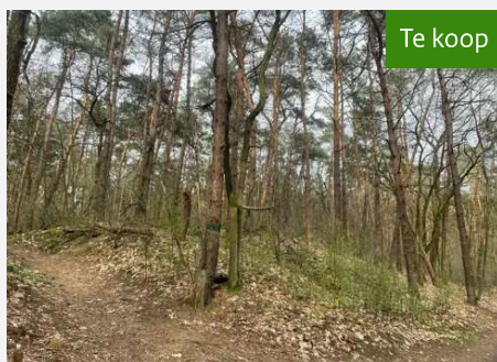
Twee bospercelen (Kavel 3.03) Grote Blerickse Bergenweg te Boekend/Venlo