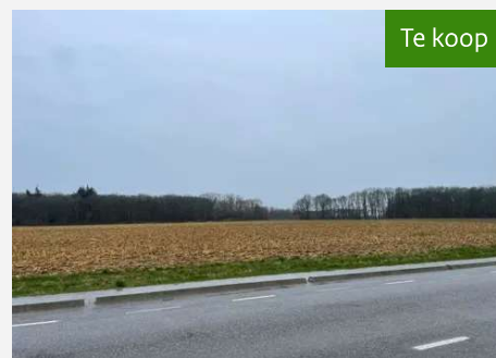
Twee bospercelen (Kavel 4.02) Lottumseweg te Broekhuizen