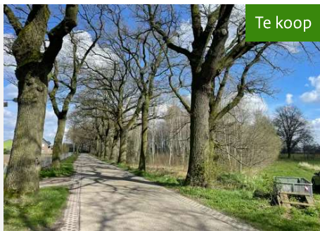
Twee bospercelen (Kavel 1.02) Herenbosweg te Horst