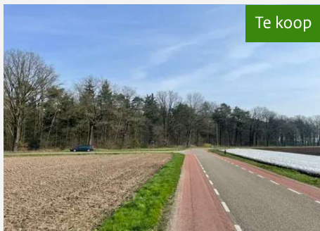
Bosperceel (Kavel 5.05) te Baarlo/Maasbree

Ander interessant aanbod Bekijk alle aanbod