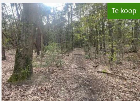
Bosperceel (Kavel 3.02) Kockerseweg te Boekend/Venlo