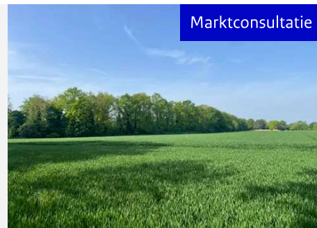
Bosperceel (Kavel 1.13) Ruitersdijk nabij Papenhoven te Obbicht