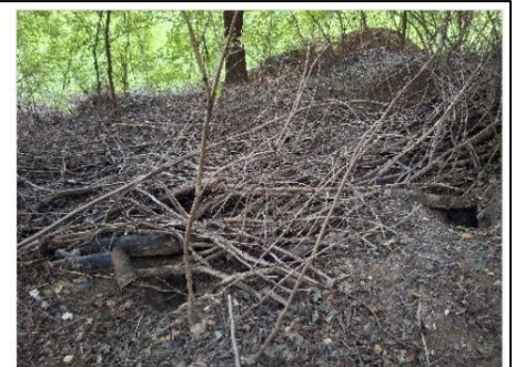
Figuur 6.12. Deel van de dassenburcht, direct ten noordoosten van de onderzoekslocatie.