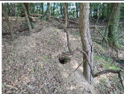
Figuur 6.11. Twee pijpen van de dassenburcht, direct ten oosten van de onderzoekslocatie.