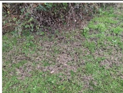
Figuur 6.10. Neusputjes langs de oostrand van de onderzoekslocatie.

“De das komt met name voor in kleinschalig akker- en weidelandschap met bosjes, heggen en houtwallen. Voor het graven van een burcht of vluchtpijpen zijn daarnaast hellingen met voldoende dekking en goed vergraafbare grond noodzakelijk. Aan de oostrand van de onderzoekslocatie, direct tegen de bosrand aan, zijn enkele vluchtpijpen aanwezig. Ook zijn hier foerageersporen (neusputjes) aangetroffen die wijzen op het gebruik van de onderzoekslocatie als foerageergebied (figuur 6.10). In het aangrenzende bos aan de oostkant van de onderzoekslocatie bevindt zich een burcht (figuren 6.11 en 6.12). Met behulp van wildcamera’s op en rondom de onderzoekslocatie is regelmatig activiteit van de das rondom deze burchten vastgesteld (Wildcam Hilkenberg). Ook is bij de eerder uitgevoerde quickscan door Econsultancy verder zuidelijk in het aangrenzende bos en in de bosschage aan de overkant van de Hilkenbergweg een aantal pijpen en een mogelijke burcht vastgesteld. Op basis van deze waarnemingen kan gesteld worden dat de onderzoekslocatie deel uitmaakt van de functionele leefomgeving van de das. Hoewel de geplande werkzaamheden uiteindelijk tot verbetering van de kwaliteit van het leefgebied zullen leiden, kunnen op korte termijn negatieve effecten niet uitgesloten worden (zie hoofdstuk 7).”